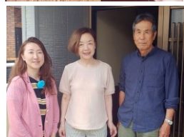
井原会長と宮崎事務局長 とご一緒に